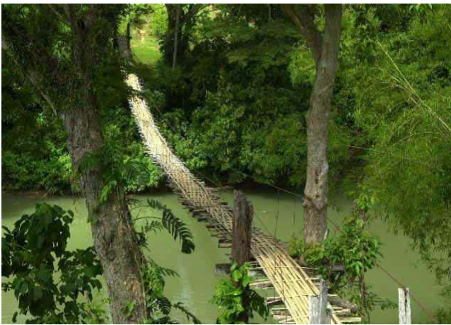
Die hängende Bambusbrücke

Ausflüge werden direkt vor Ort, vom Resort organisiert