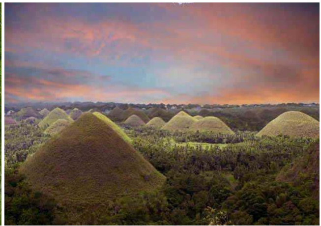
Die Chocolate Hills (über 1.400 auf Bohol)