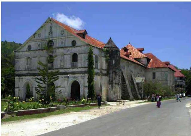
Die Loboc – Kirche